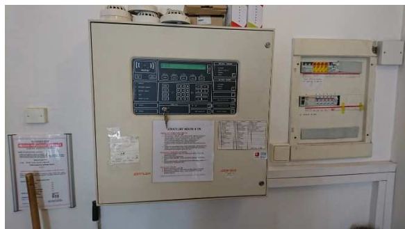
Obrázek 4: Ústředna EPS