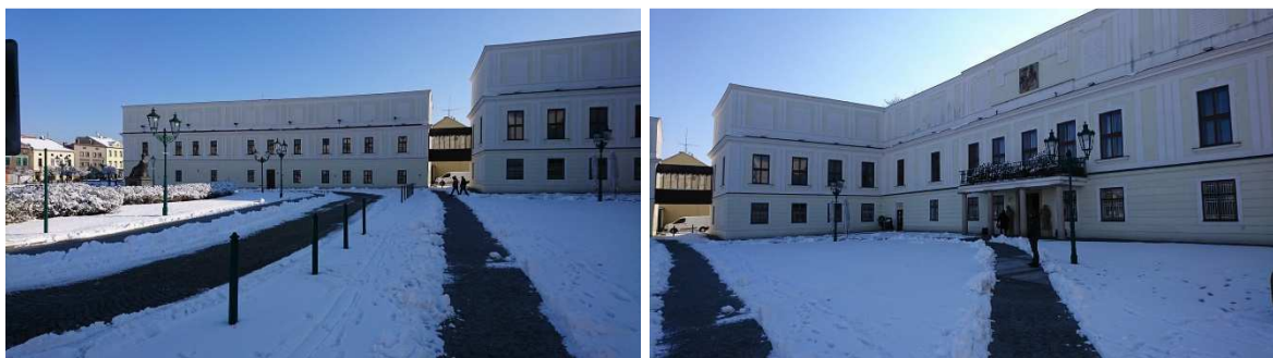
Obrázek 1: Objekt LOTTYHAUS a zámek