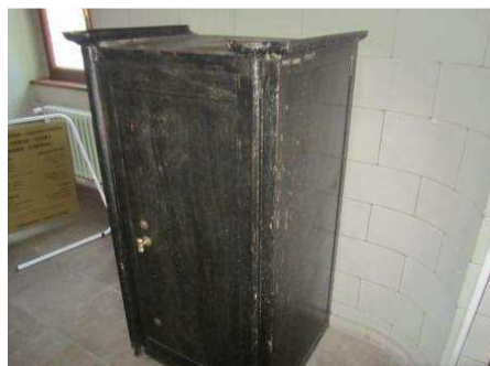
Obrázek 3: Trezor nezjištěné konstrukce

U příspěvkových organizací města jsou finanční částky vyšší (dle sdělení i okolo 100 000,- Kč)