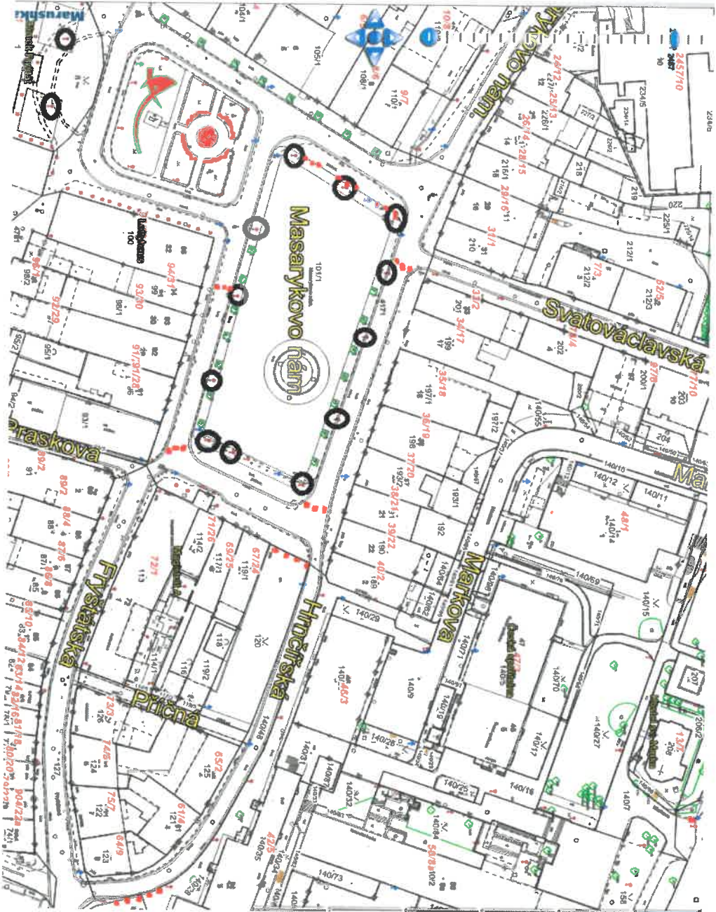
Příloha č. 1, Situační zakres objektu údržby