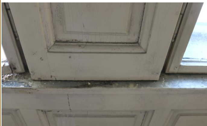
Táflování mezi okny