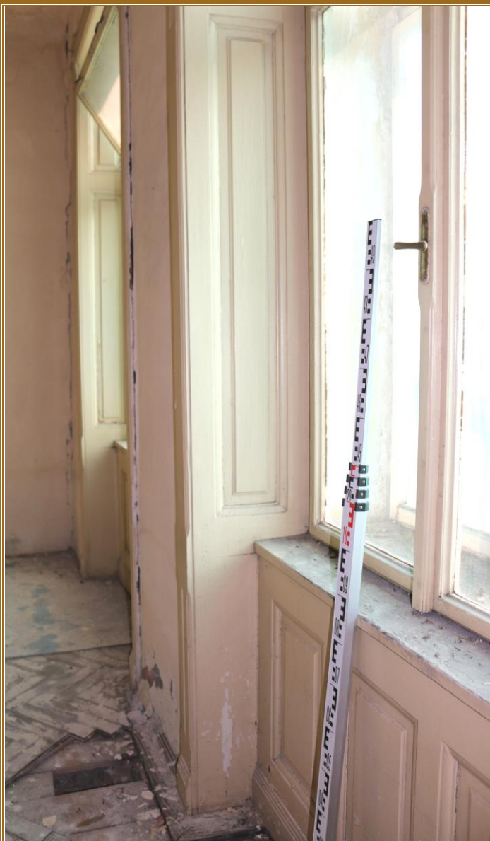
Deštění pod parapetem