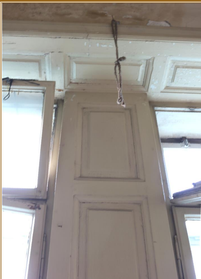
Táflování mezi okny