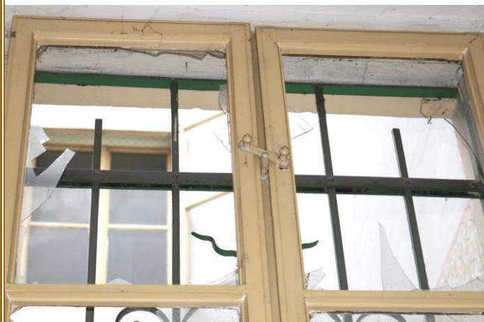
Pohled z interiéru, nadsvětlík