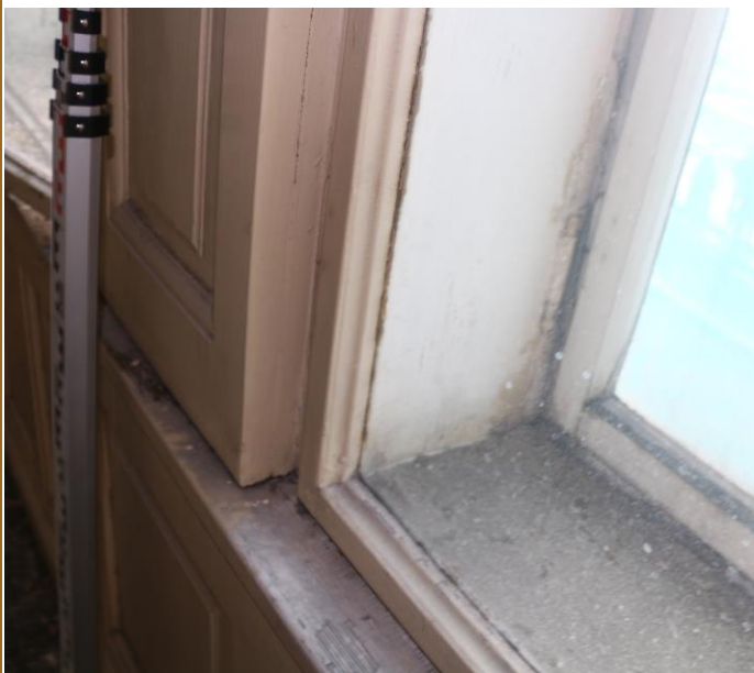
Parapet a střední táflování