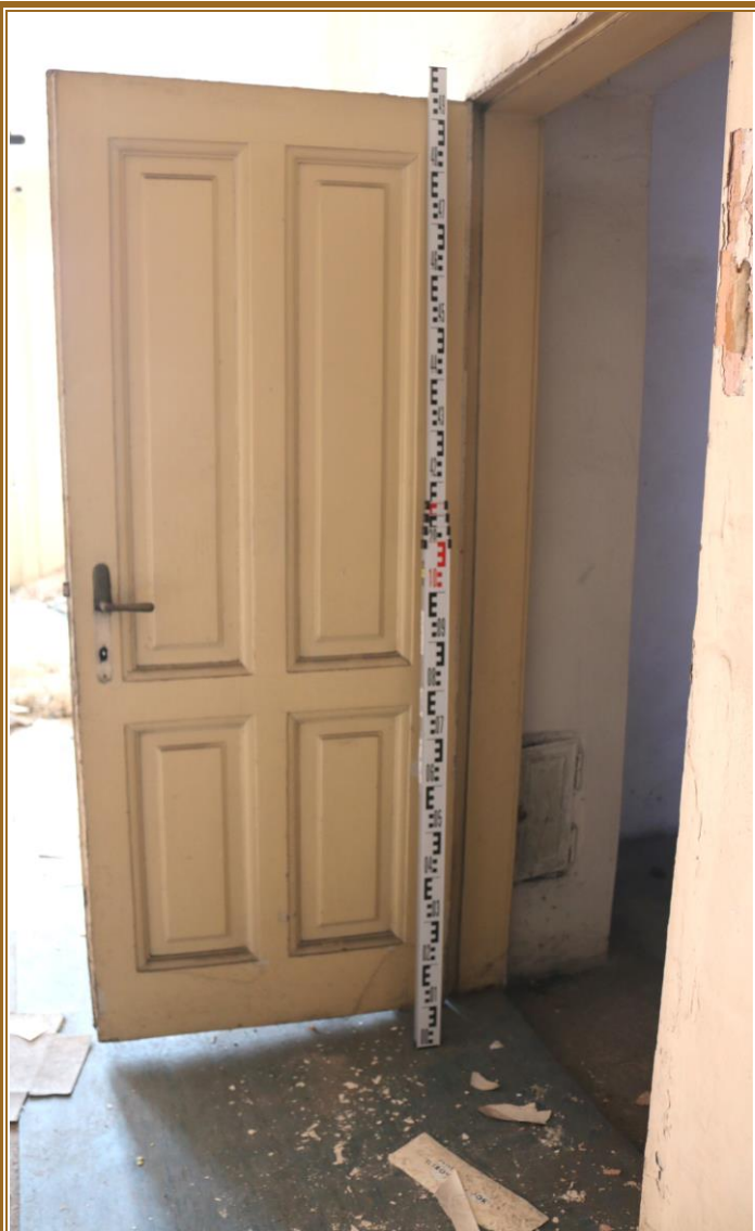
Pohled z místnosti 278