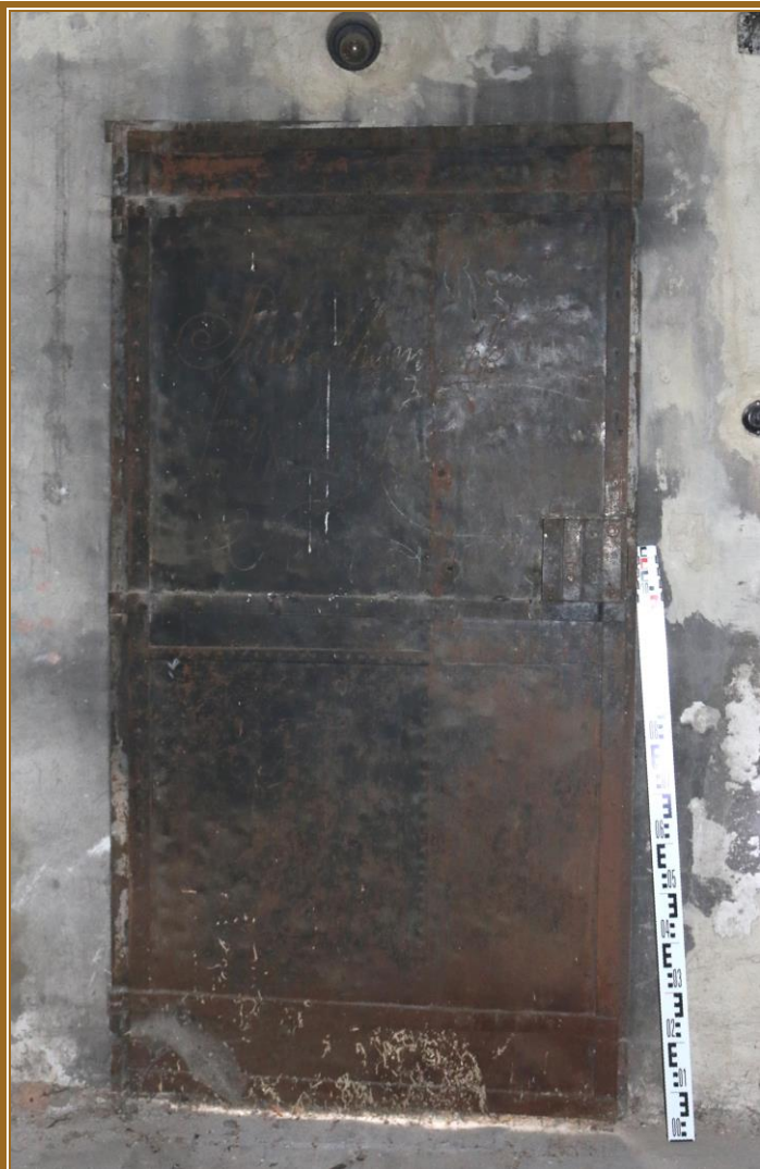
Dveře ze strany půdy