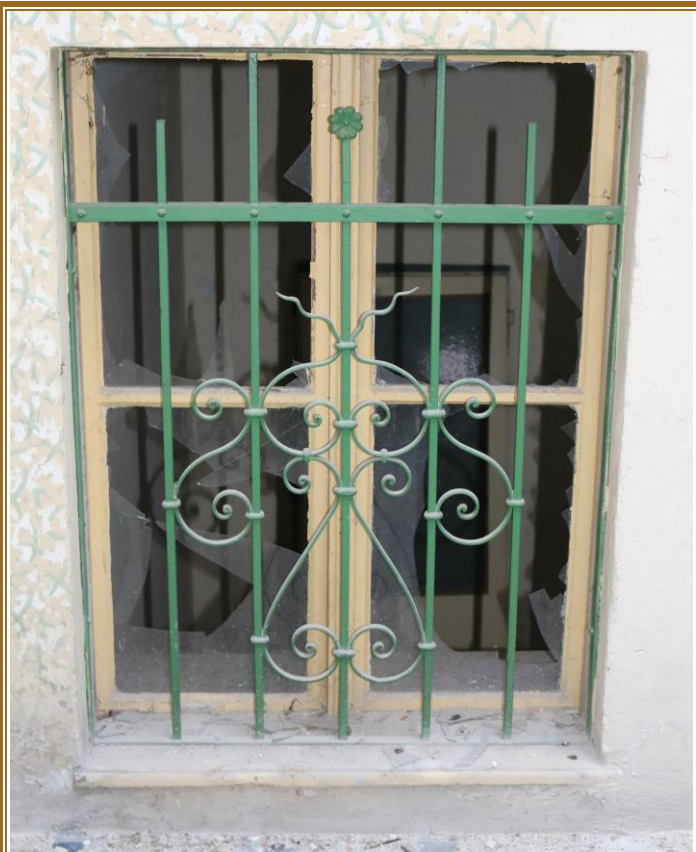
Pohled ze schodiště, mříž