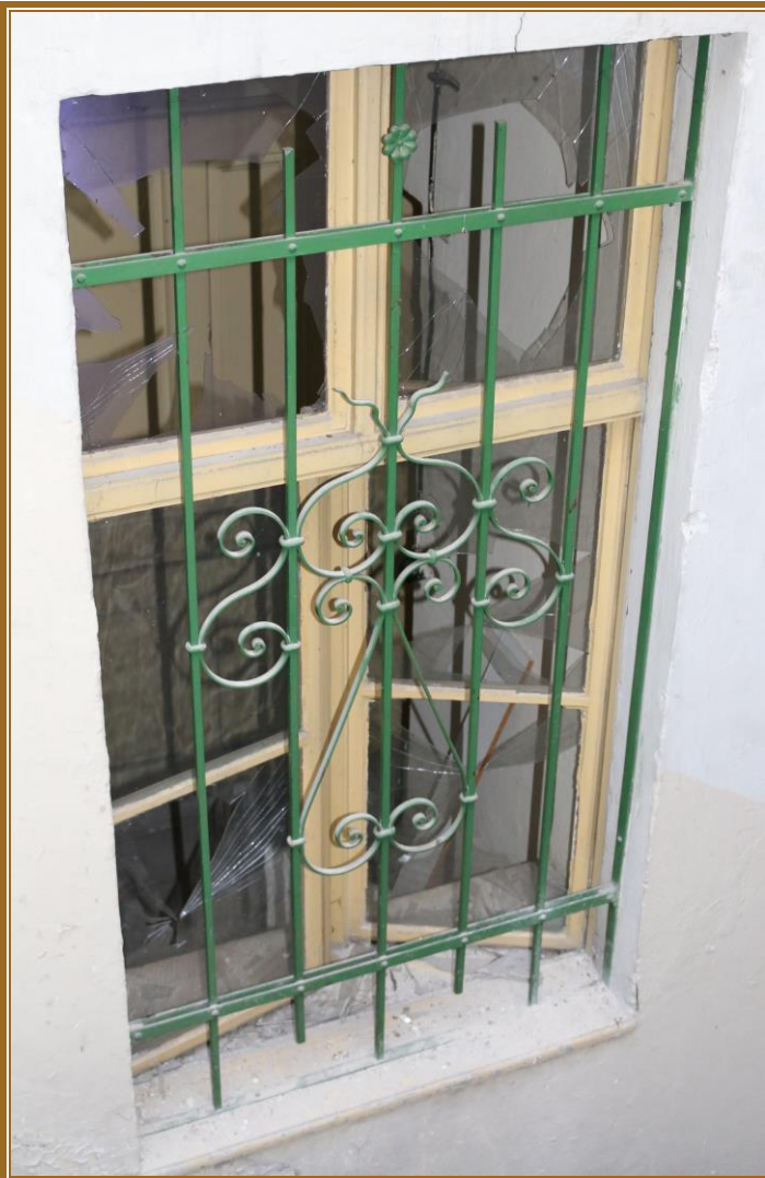
Pohled ze schodiště 271