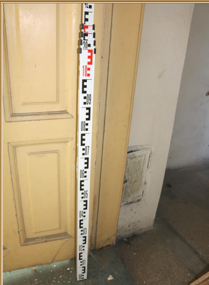
Dveře ze strany 278