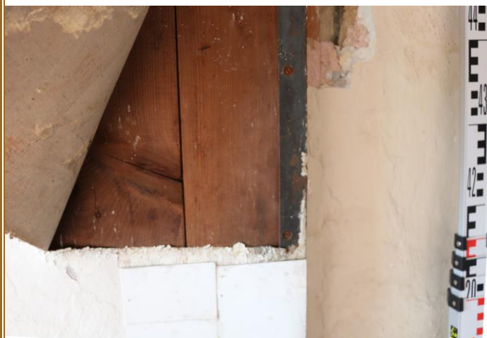
Dveře ze strany 277, detail skladby křídla ze skryté strany