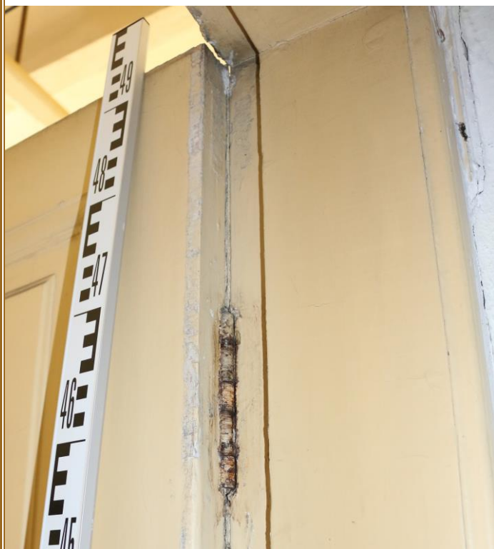
Detail skrytého pantu