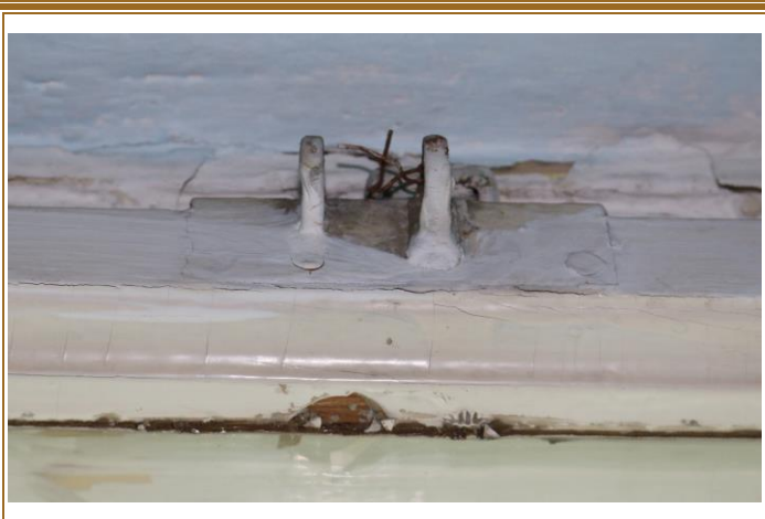
Detail otevírání vnitřního křídla nadsvětlíku