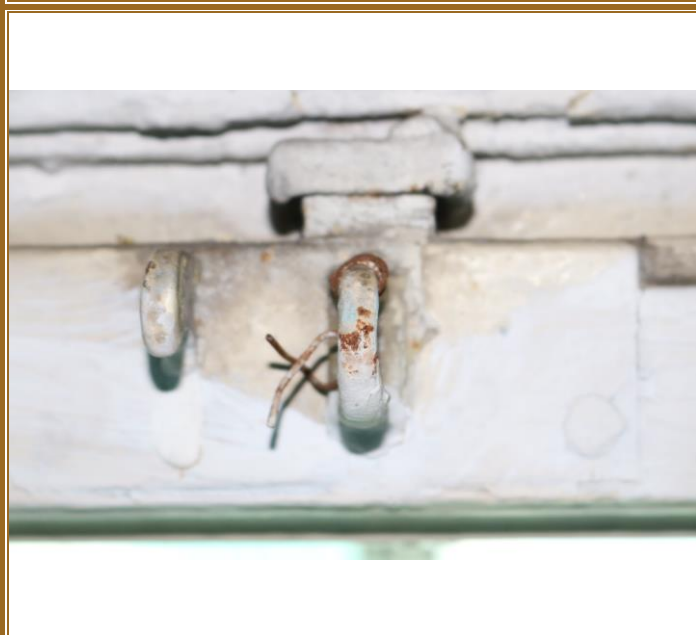
Detail otevírání vnitřního křídla nadsvětlíku