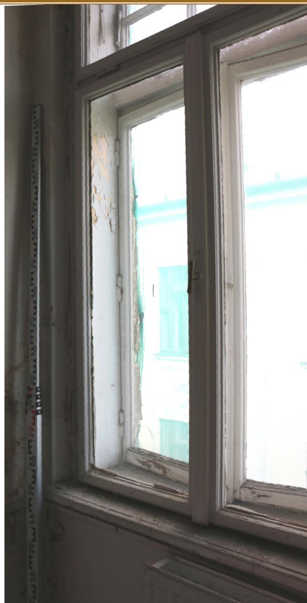
pohled z interiéru , detail spodních křídel