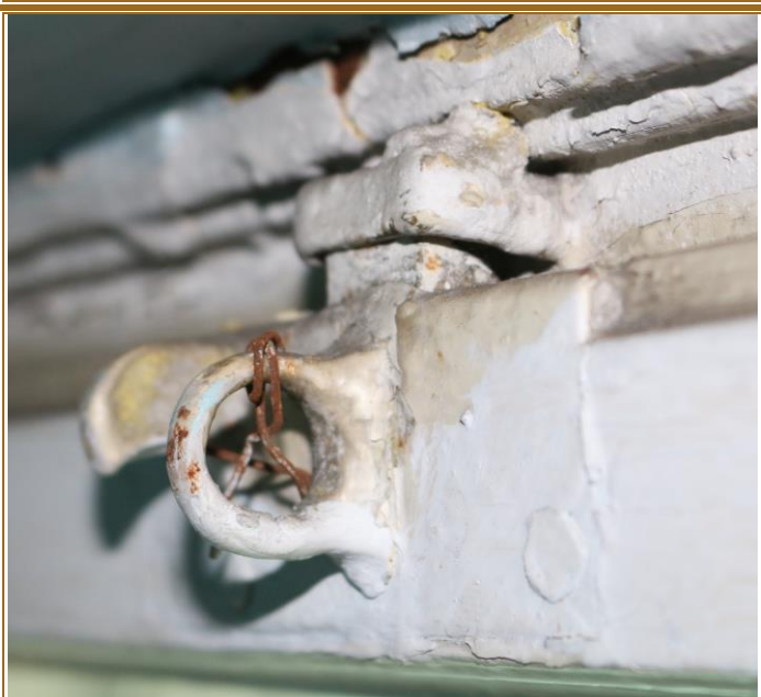
Detail otevírání vnitřního křídla nadsvětlíku