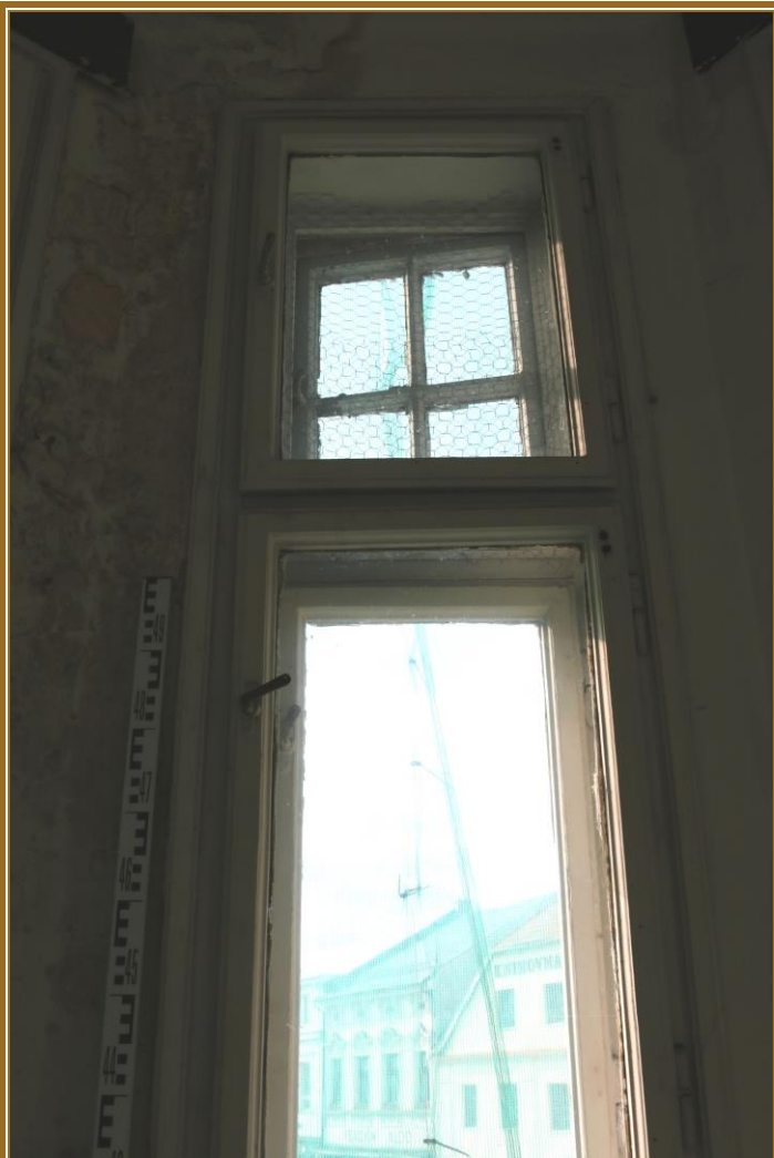
Okno 4, nadsvětlík zevnitř