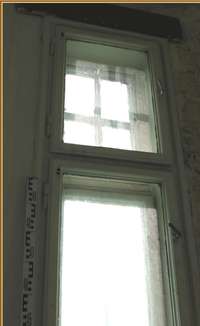
Okno 3 - horní část a nadsvětlík