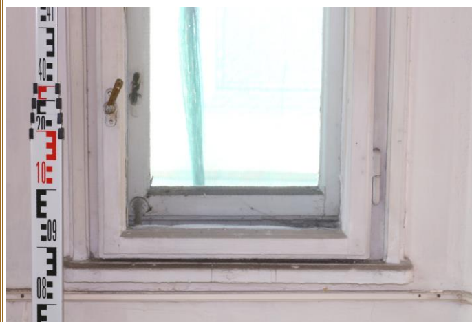
Okno 5 spodní část