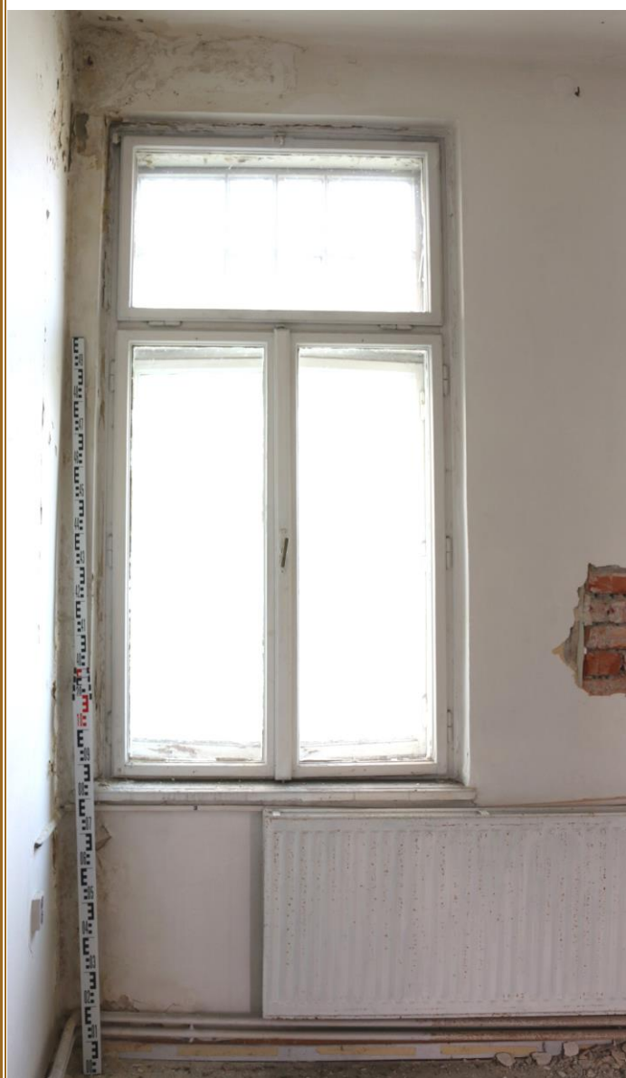
pohled z interiéru