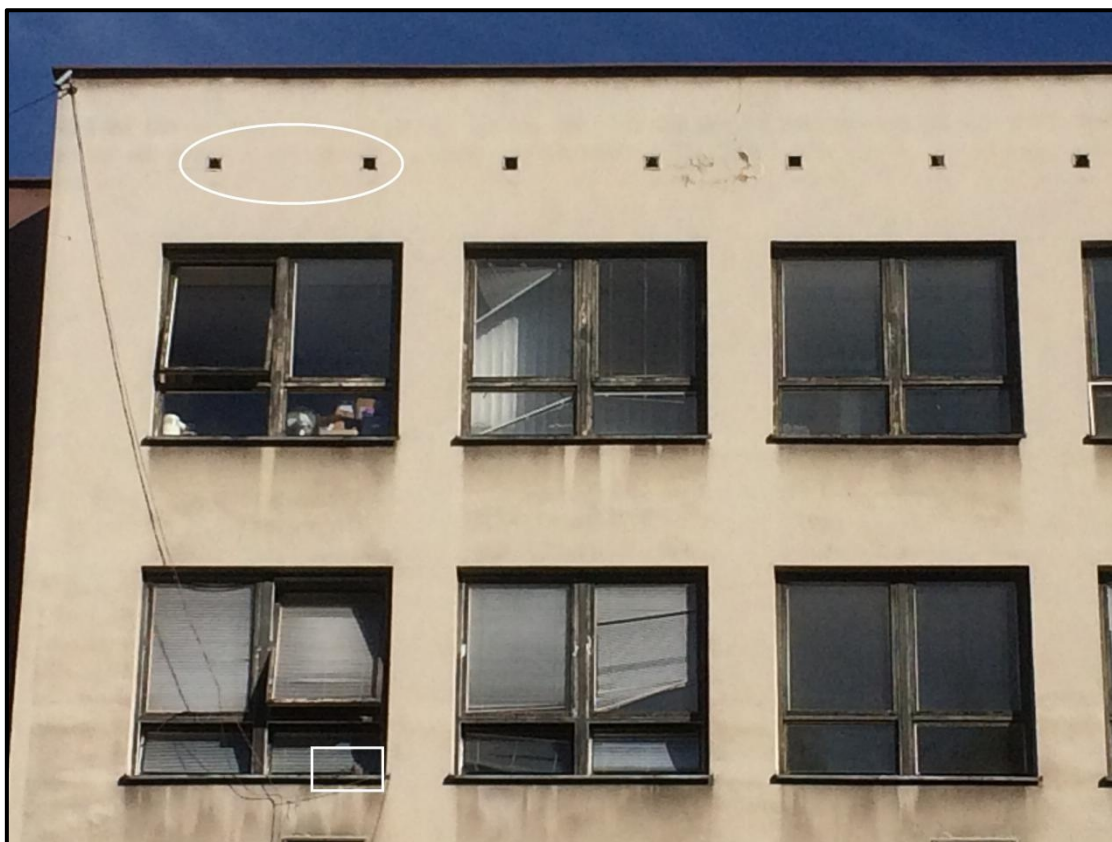
Obr. 1: Hnízdiště poštolky obecné někde v dutině za podstřešními ventilačními otvory (elipsa) a základ hnízda holuba hřivnáče s dospělým jedincem (obdélník) na JV straně komplexu