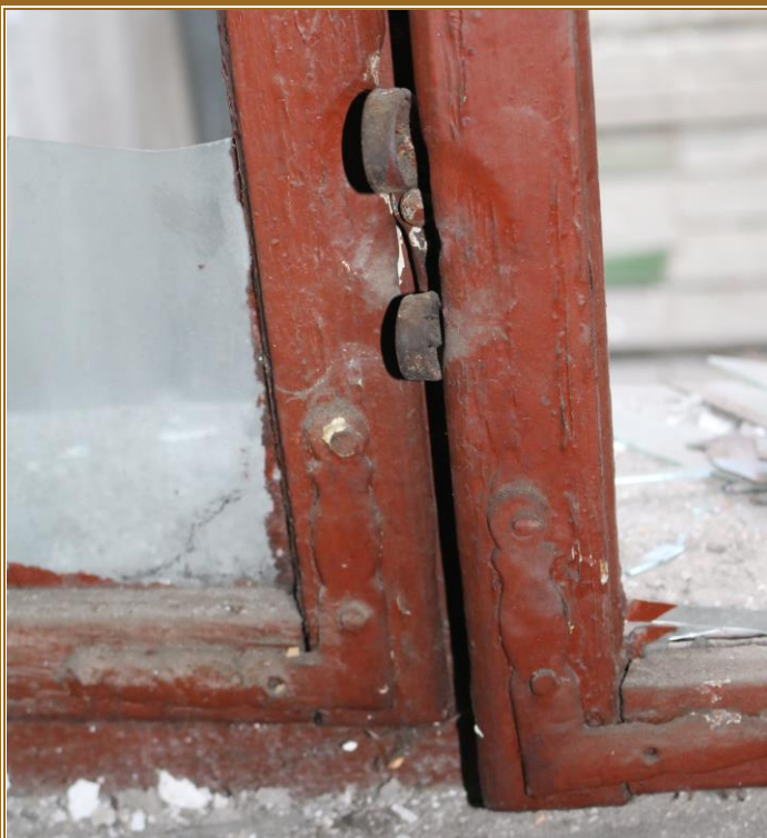
Obrtlík a rohovníčky