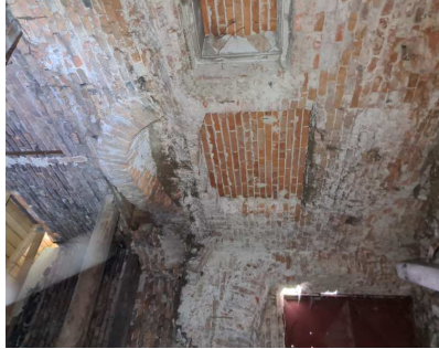
okno z interiéru