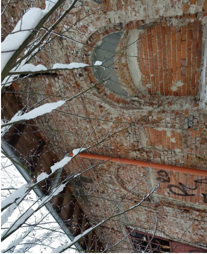
okno z exteriéru